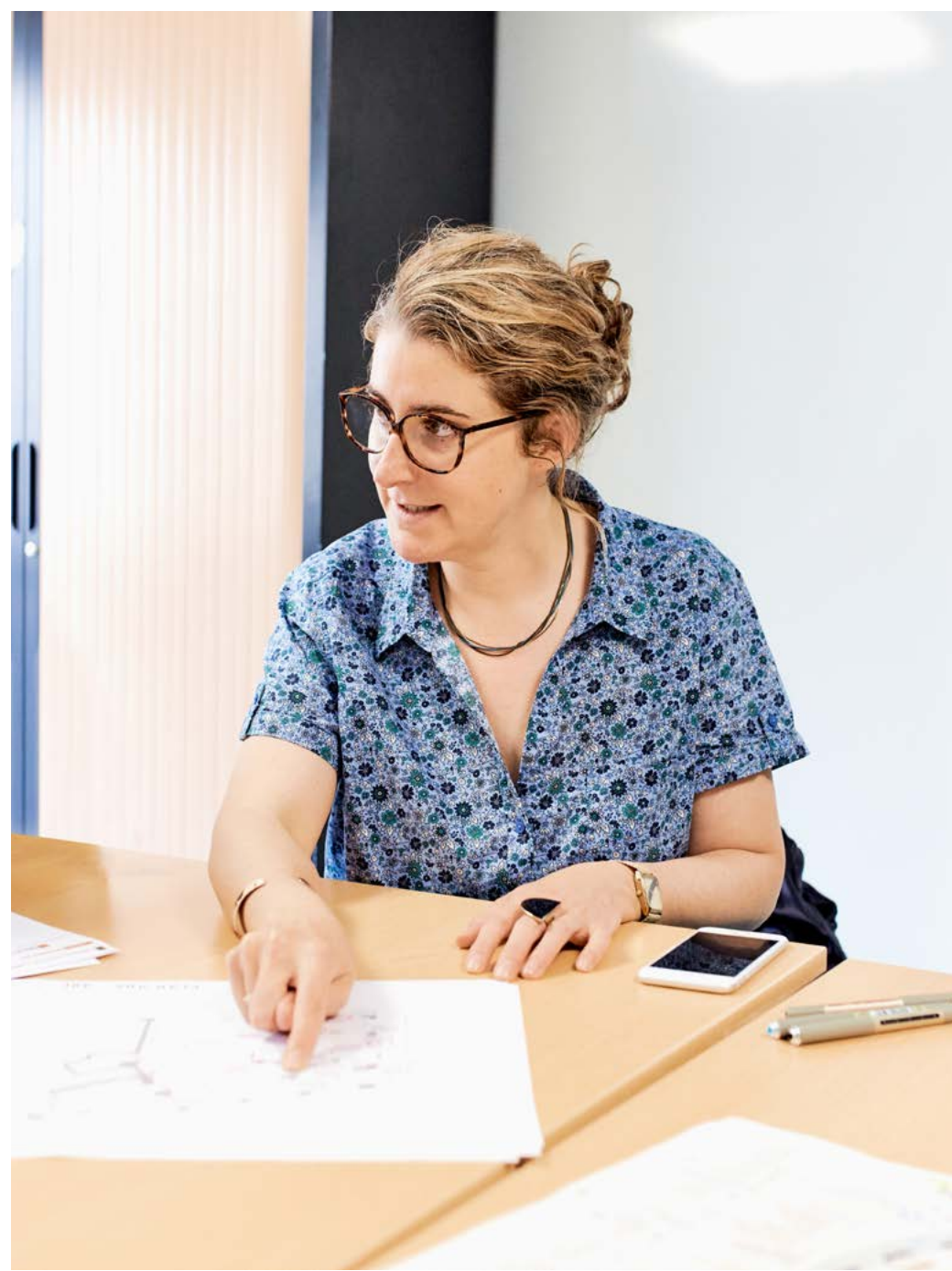
Lucie Ninney, agence NeM / Ninney & Marca Architectes