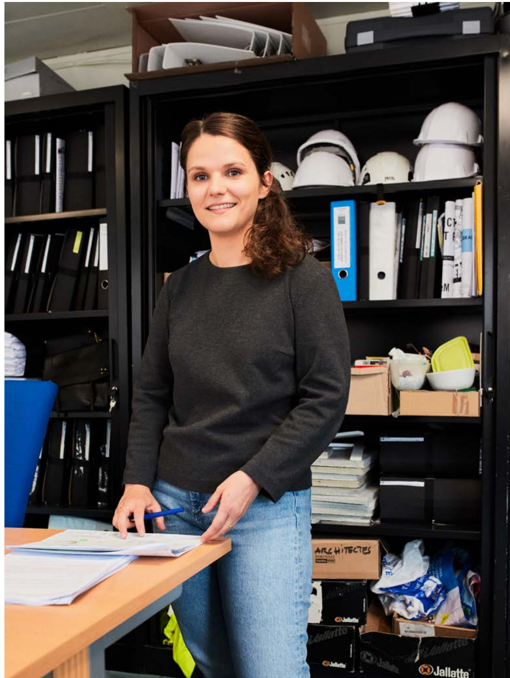
Mariette Piéjak, agence NeM / Niney & Marca Architectes