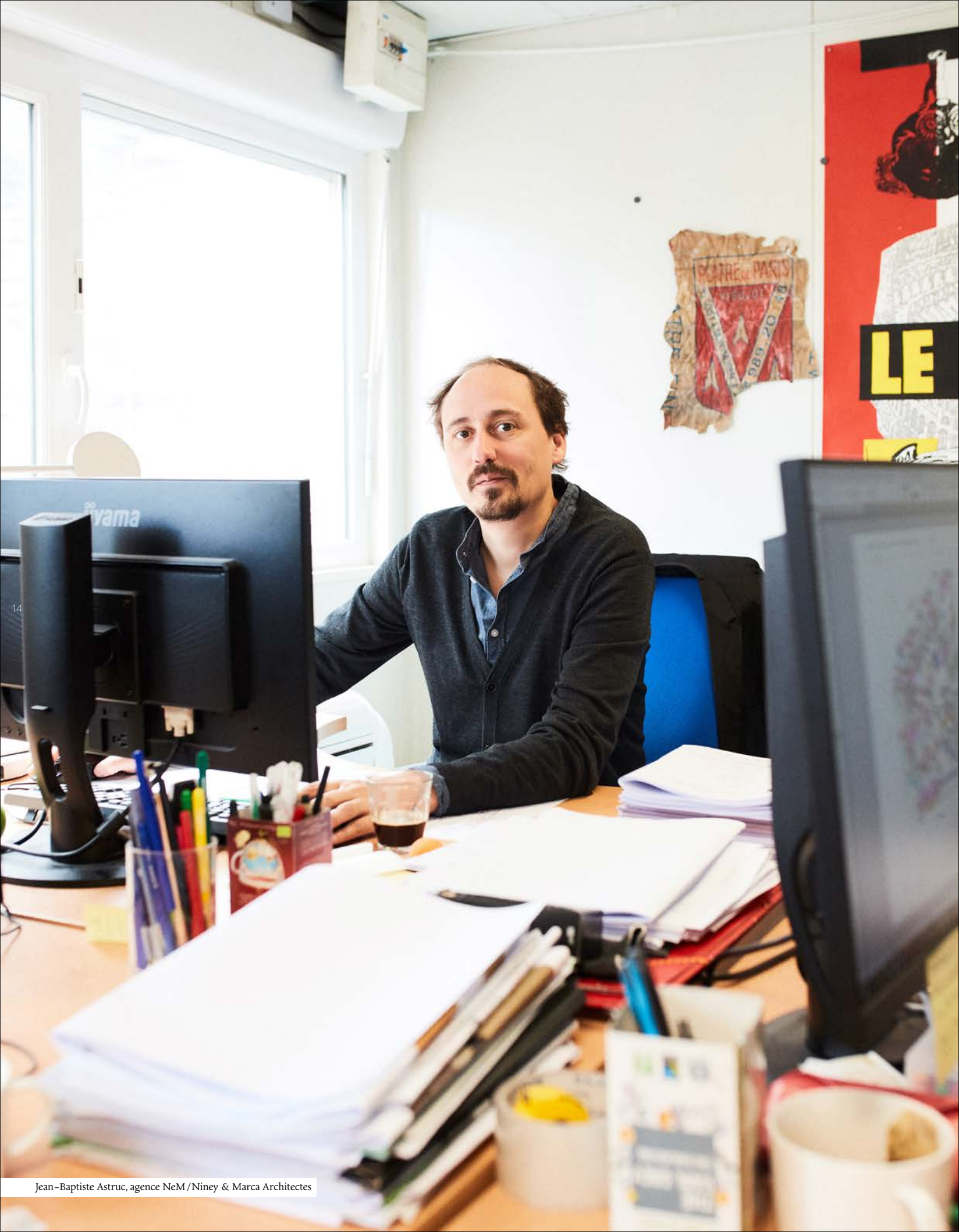
Jean-Baptiste Astruc, agence NeM/Niney & Marca Architectes