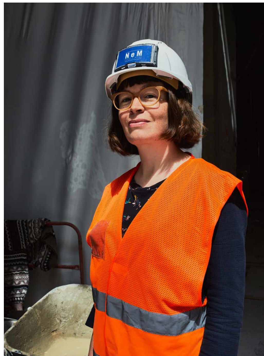
Hélène de l'Espinay, agence NeM/Niney & Marca Architectes