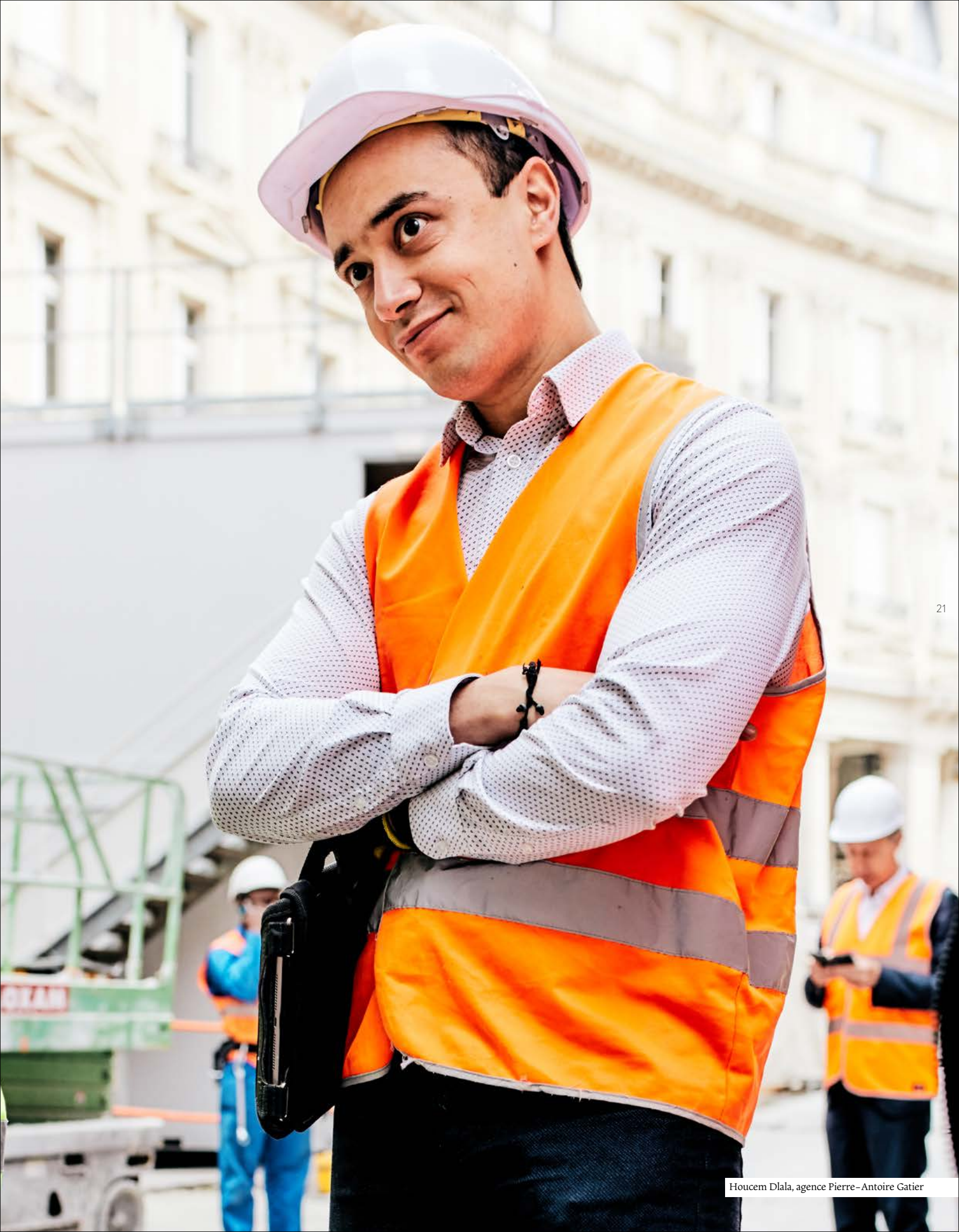
Houcém Dlala, agence Pierre-Antoine Gatier